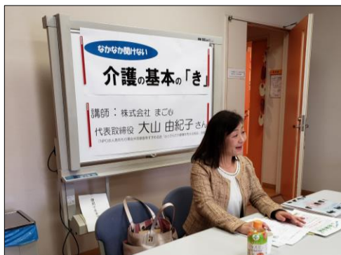
▲一昨年の講座より