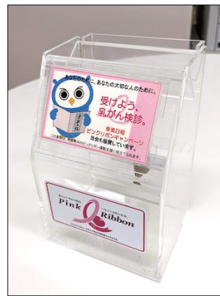
▲(有)ビックジャパンカースーパー本社での贈呈式 ▲青森ドラッグストアショーチラシ ▲東奥日報様との連携募金箱